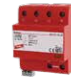
相关信息，不承担责任